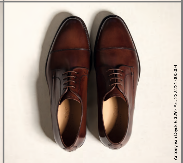
Antony van Dijk € 329,- Art. 232.221.000004

Auch in dieser Saison ein unverzichtbares Must-Have. Diese Klassiker präsentieren sich in einem frischen, modernen Look, der Eleganz und Komfort perfekt vereint. Angesagt sind schlanke, maskuline Silhouetten mit klaren Linien, die Charakter zeigen. Dunkle Töne wie Schwarz, Braun und Cognac dominieren, ergänzt durch trendige Farbakzente in Royalblau. Diese Farbpa-