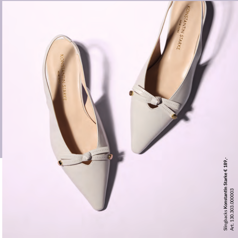
Slingbacks Konstantin Starke € 189,- Art. 130.303.000003