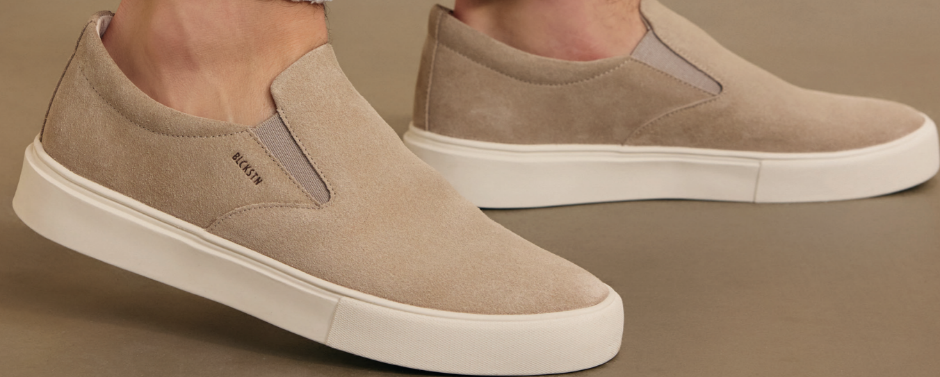
Blackstone Ruby Banks DG508 Lemon Pepper