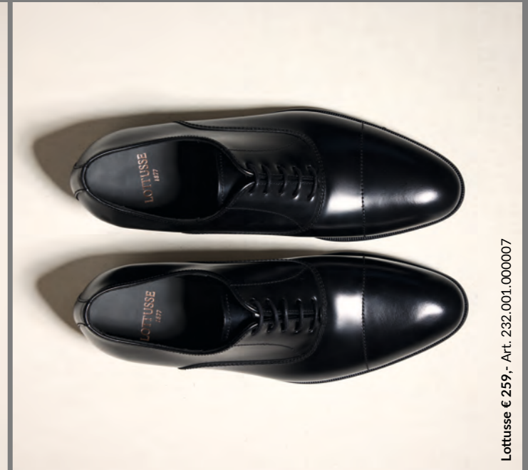
Lottusse € 259,- Art. 232.001.000007