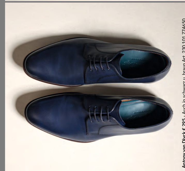
Antony van Dijk € 295,- Auch in schwarz u. braun Art. 230.101.774650