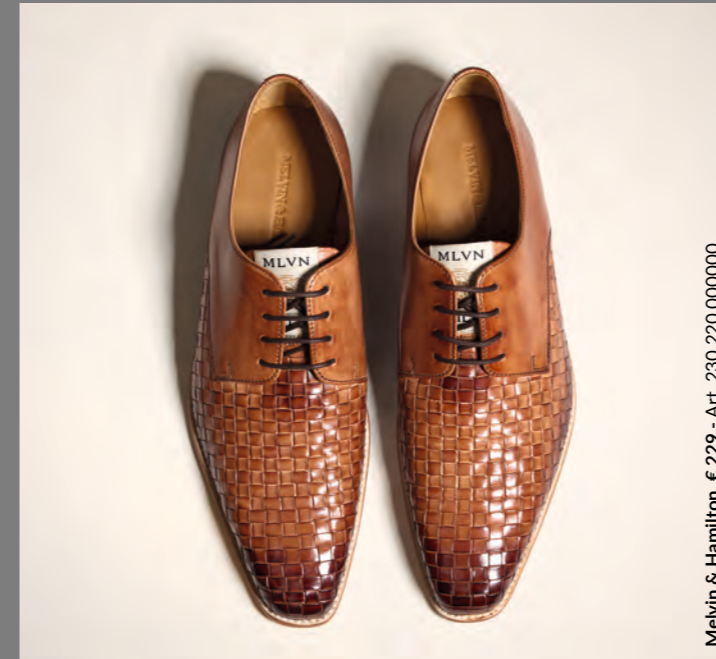
Melvin & Hamilton € 229,- Art. 230.220.000000