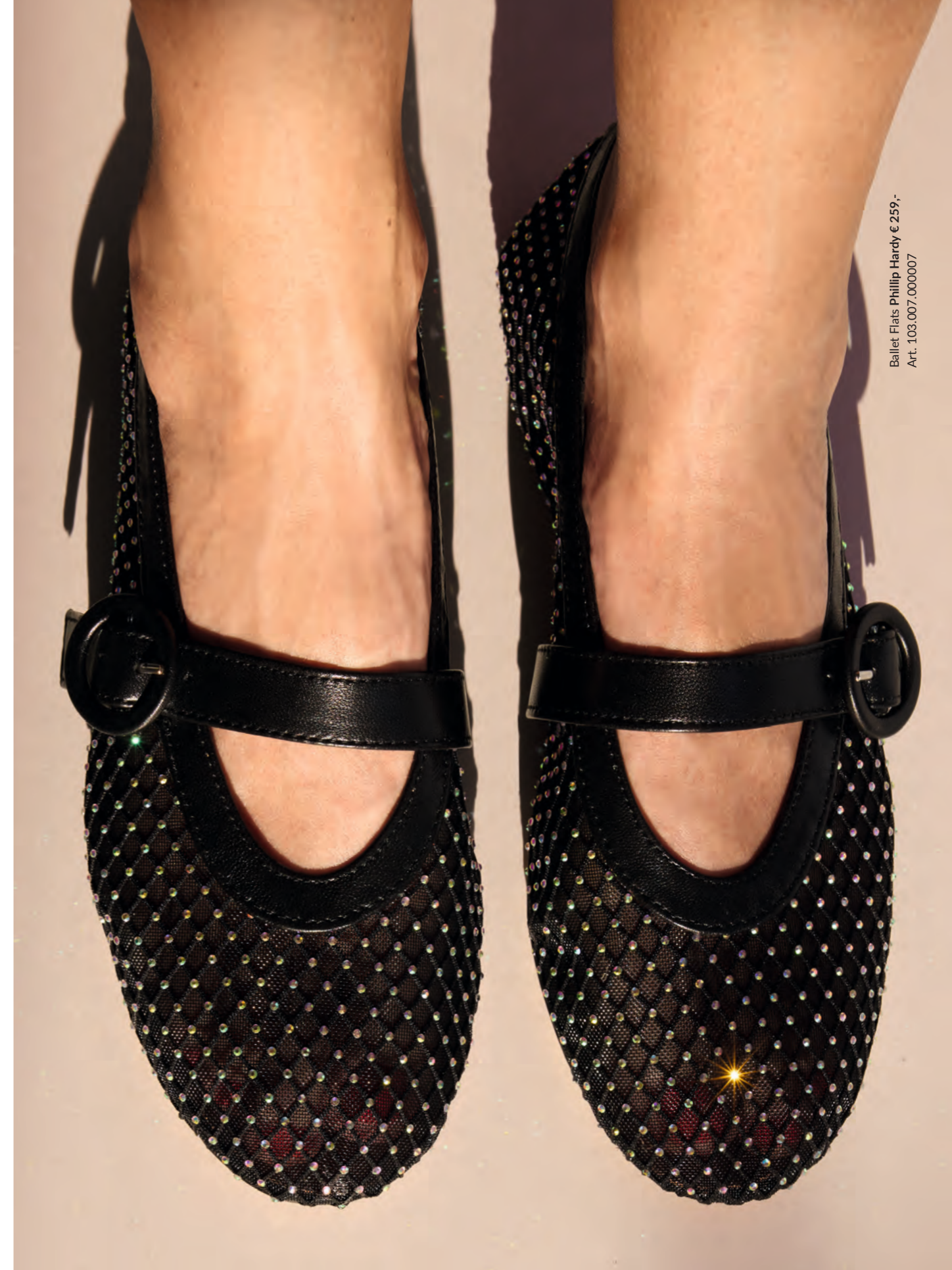
Ballet Flats Phillip Hardy € 259,- Art. 103.007.000007

Die Farbpalette für Frühling/Sommer 2025 reicht von sanften Pastellen bis zu kräftigen Tönen und spiegelt den Sommer wider. Transparente Materialien, glänzende Lackoberflächen und schlichte Designs dominieren die Saison.