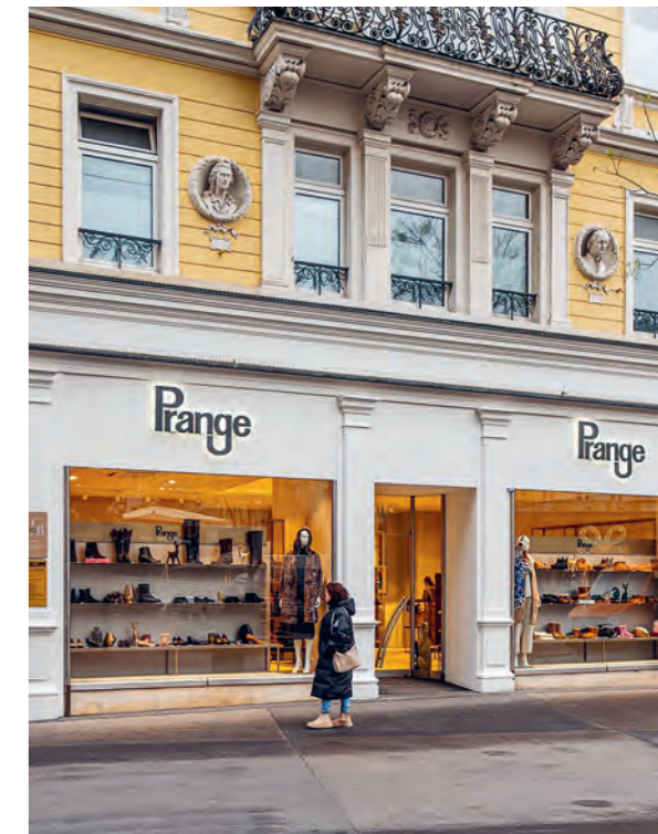
Lichtentaler Str. 2, 76530 Baden-Baden